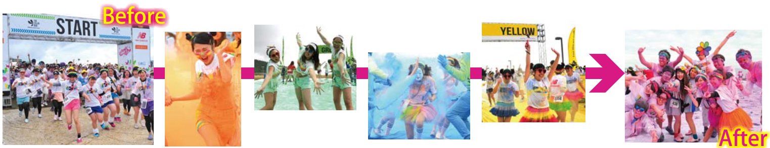
THE COLOR RUN OSAKA